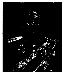
พลโท เติเรกพล วัฒนะโชติ อดีตหัวหน้าสำนักตุลาการทหาร และอดีตกรรมการตุลาการศาลปกครองผู้ทรงคุณวุฒิ