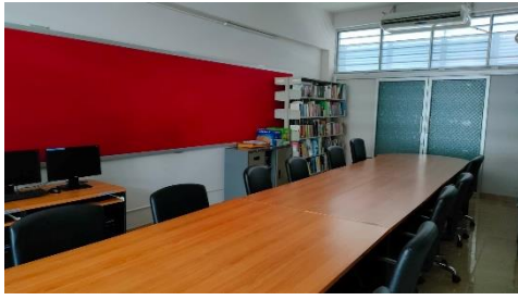
ห้องสมุดกลาง (สำนักวิทยบริการและเทคโนโลยีสารสนเทศ) สำหรับการสืบค้น

คลินิกวิจัย คณะมนุษยศาสตร์และสังคมศาสตร์