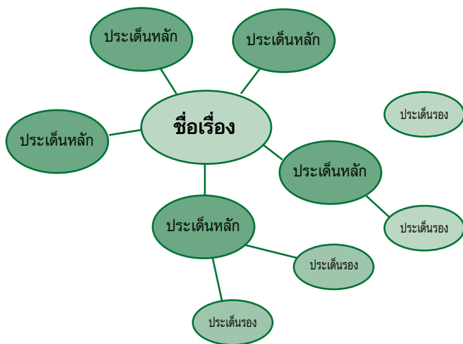
ภาพที่ 3 การระดมสมองและแตกความคิด แบบดาวกระจายล้อมจันทร์

การระดมสมองเป็นการระดมความคิด และความรู้ที่เป็นประเด็นเรื่องที่จะเขียน และสื่อสารเป็นตัวอักษรโดยอาจทำเป็นต้นไม้แตกกิ่งก้านสาขา เส้นเลือดแตกแขนง เส้นเลือดฝอย รูปก้างปลาและแตกแขนง หรือเป็นแบบดาวกระจายล้อมจันทร์ ซึ่งเป็นตัวอย่างที่นำเสนอในที่นี้